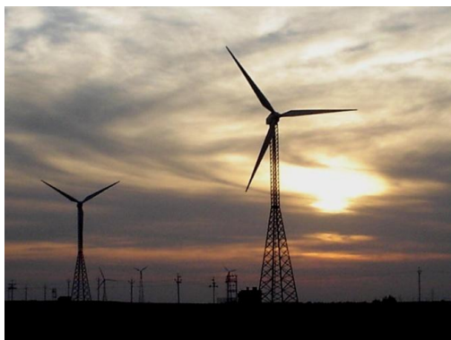
(風力発電プロジェクト)

オフセット手続きについては、株式会社リサイクルワンならびに一般社団法人日本カーボンオフセットを通じて行っています。(別紙「カーボンオフセット証明書」参照)