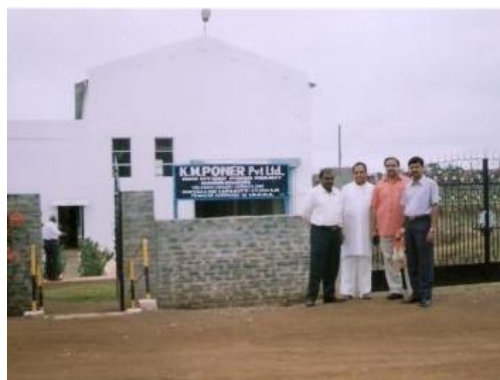
(水力発電プロジェクト)

* オフセットの対象は、保険事故対応業務および保険のWeb申し込みにおいて排出するCO 2 量としていますが、実際にオフセットする量は前記のとおり1件につき50円の定額としています。したがって、オフセットの対象から排出されるCO 2 の算定結果に基づき実施しているものではありません。なお、カーボンオフセットの仕組みについては、弊社ホームページをご参照ください。 ( http://www.nipponkoa.co.jp/environment/carbon_off_set.html )