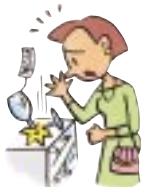
買い物中商品を壊した