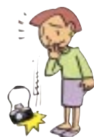
カメラを落として壊した