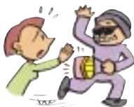
バックをひたかれた